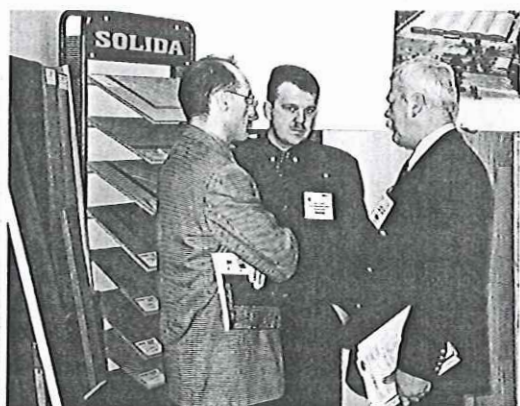
De stand van Rover's Flooring trok vele bekenden.

is goed. Uit groeicijfers blijkt dat je tegenwoordig niet meer aan de Britse markt voorbij kunt gaan," aldus een woordvoerder.